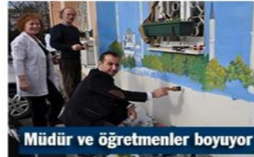
Müdür ve öğretmenler boyuyor

Tuzla Halk Eğitimi Merkezi Müdürlüğü'nün duvarlarını ülkemizin nadide tarihi eserleri süslüyor.