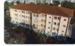
Tuzla Halk Eğitimi Merkezi