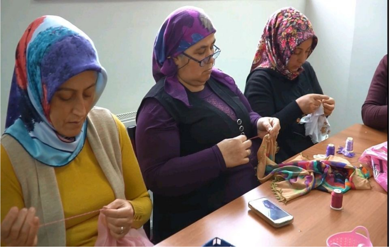
Tuzla Süleyman Demirel Mesleki Ve Teknik Anadolu Lisesi'nde El Sanatları Kursu Açılmıştır.