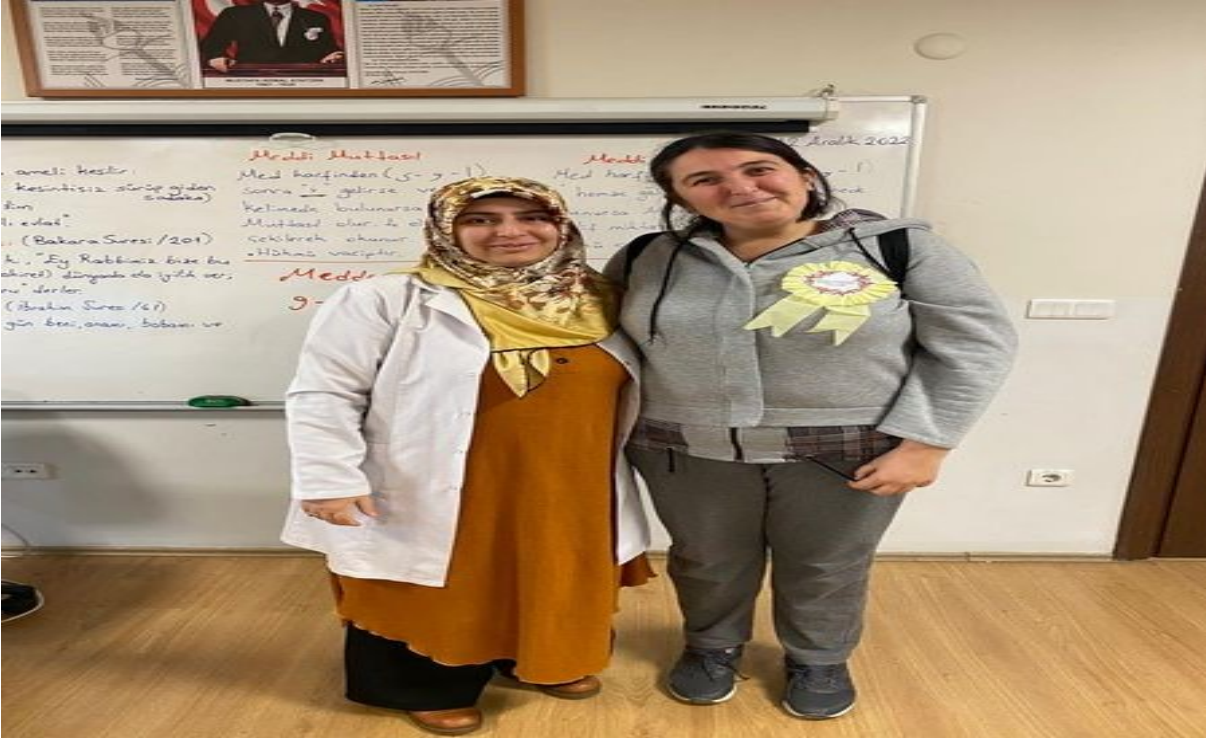
Tuzla Belediyesi Şifa AÇEM Kur'anı Kerim'i Okumaya Geçenlere Rozet Takılması Etkinliği.