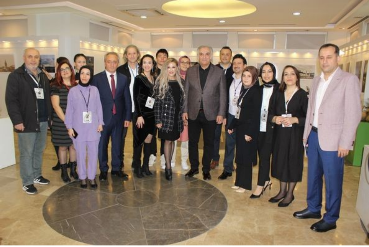
Köşe Bucak İstanbul Temalı Fotoğraf Sergimizin Açılışı