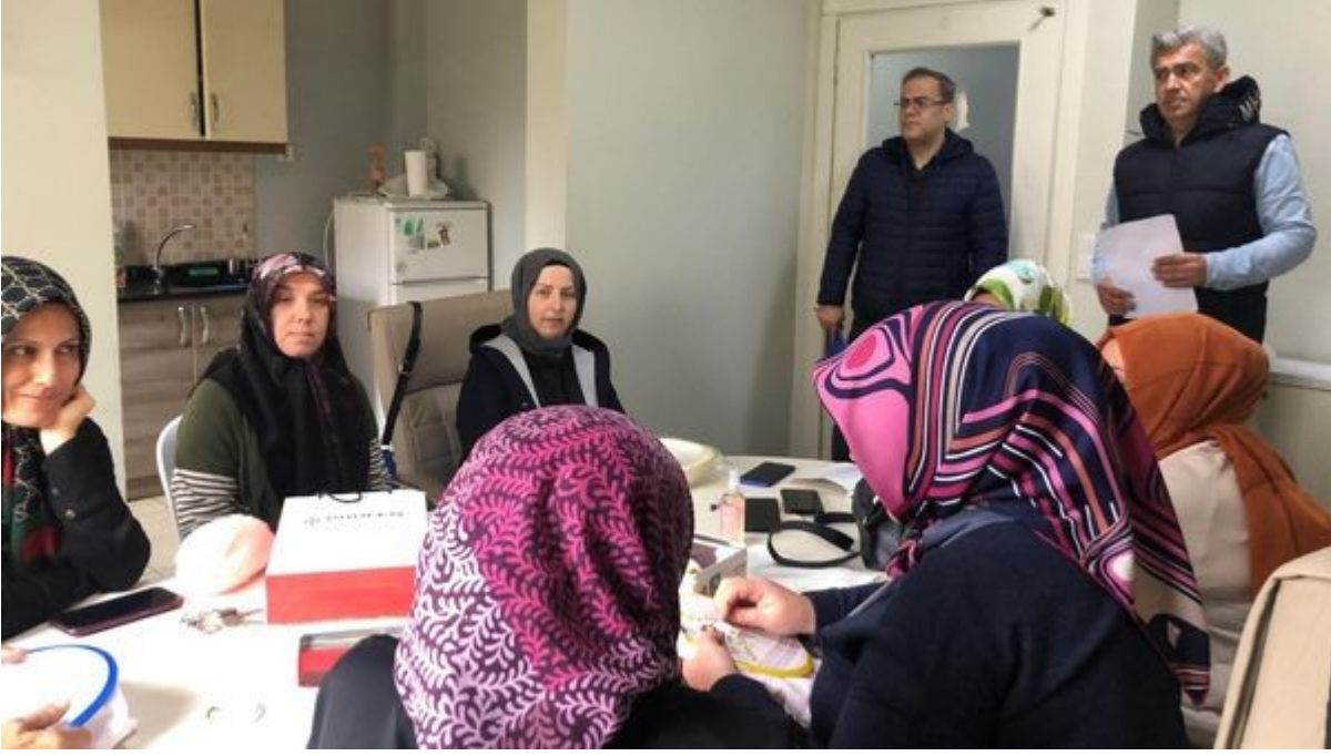
Alanlardaki Kurs Ziyaretlerimiz