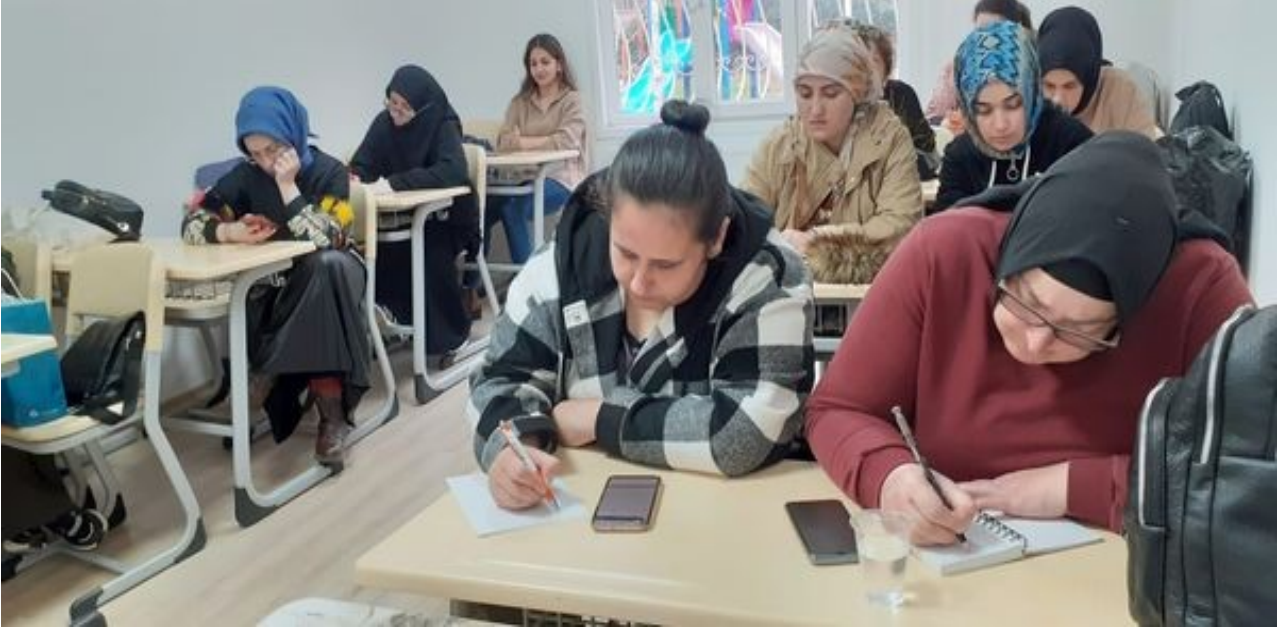
Tuzla Belediyesi Yayla AÇEM A1 Seviye İngilizce Kursu.