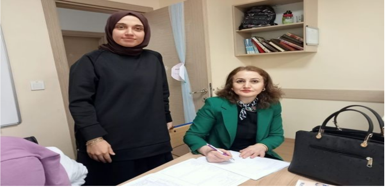
Alandaki Kurslarımızı Ziyaret Ediyoruz.