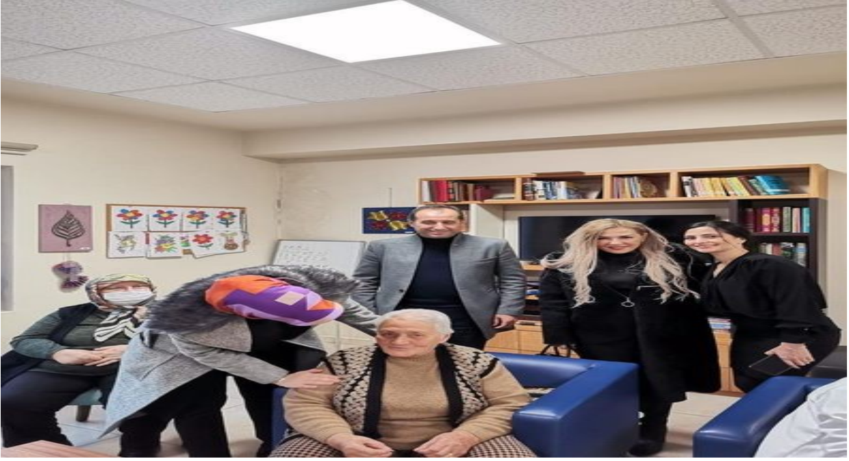
Cilt Bakımı Kursiyerlerimiz Tuzla Belediyesi Yaşlılar Merkezi Sakinlerini Ziyaret Etiler.