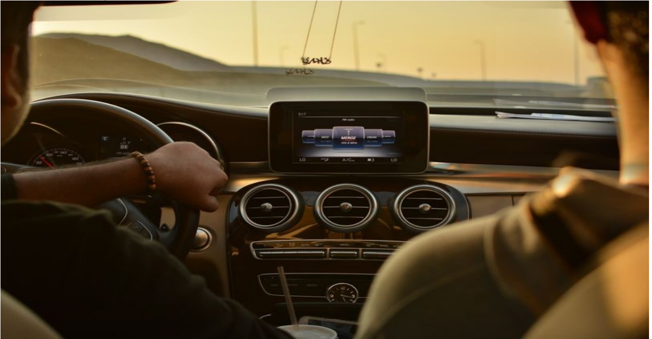
MTS Direksiyon Eğitimi Öğreticiliği Kursu, Trafik Ve Çevre Öğreticiliği Kursu Açıldı.