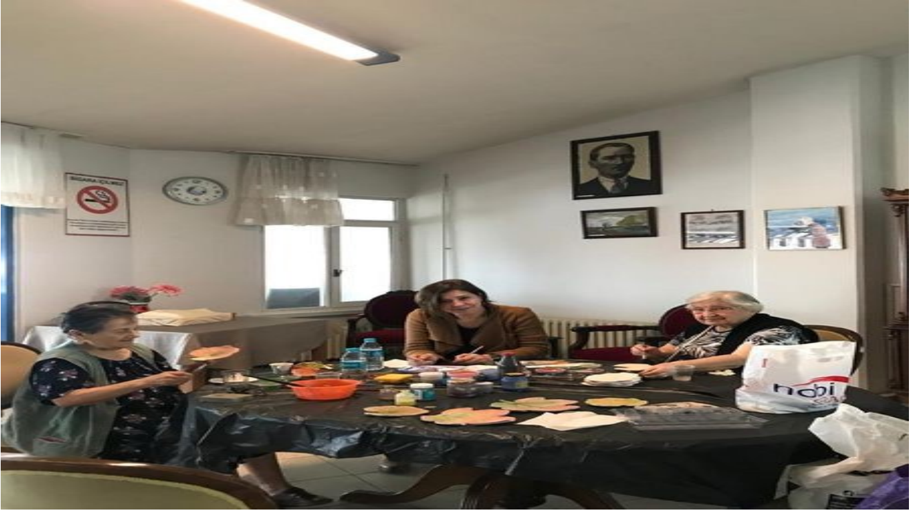
Büyüklerimize hürmet; vazifemiz ve arzumuzdur. Kasev Huzurevi Sakinleri Seramik Çalışmaları.