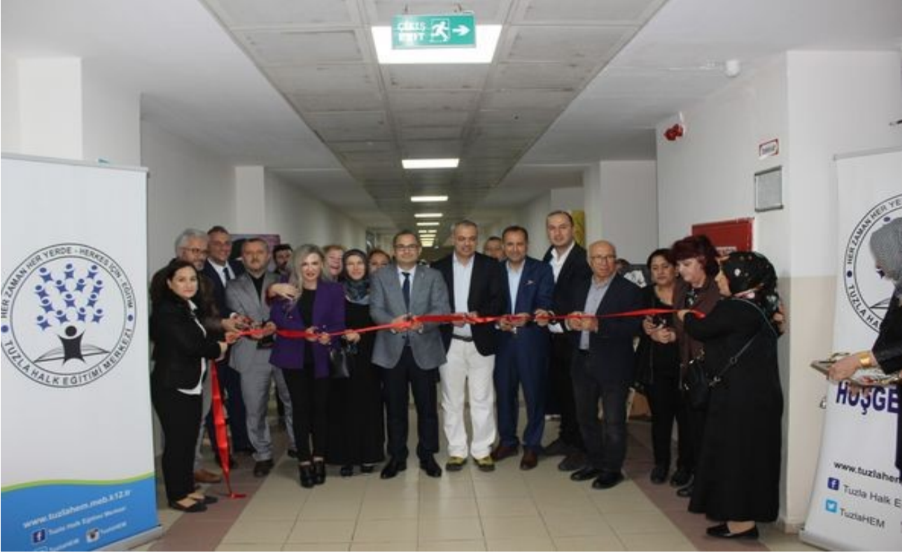
Mimar Sinan İlkokulu Karma Sergimiz Protokol ve Misafirlerimizin Katılımıyla Açıldı.