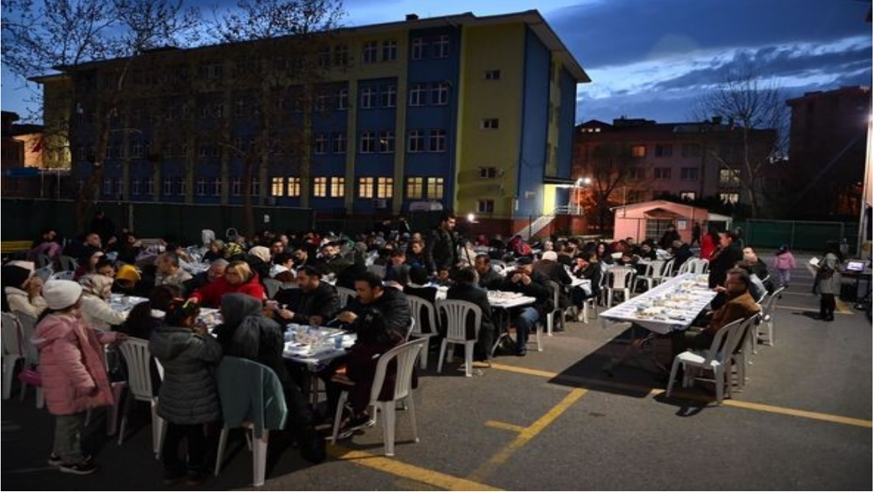
Gelenekselleşme Yolunda Çaba Sarf Ettiğimiz Tuzla HEM İftar Yemeği'nin 8.Düzenlendi.