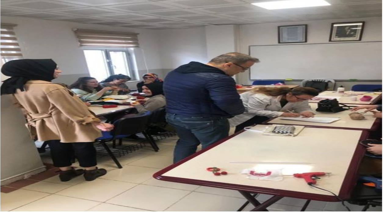
Kurs Ziyaretlerimiz Devam Ediyor.