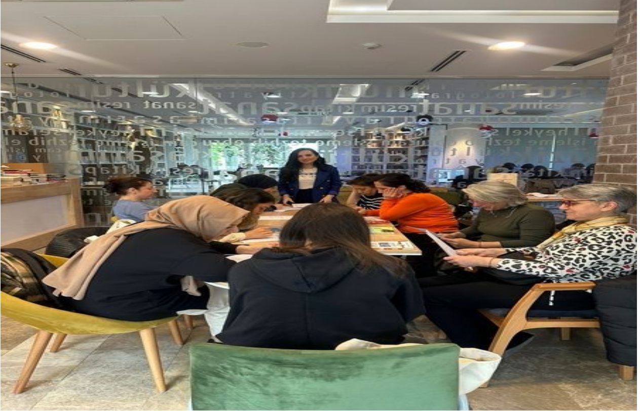
Etkili okuryazarlık dersi kapsamında ; Tuzla Belediyesi Rumeli Kltr Merkezi'nde , atlye alıřmamız