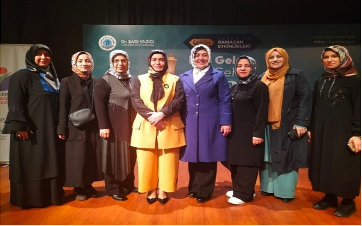
Tuzla Belediyesi Açem Kur'an'ı Kerim Kursu Öğretmenleri ve Kursiyerlerince Şifa Kültür Merkezinde Ramazan Programı Düzenlendi