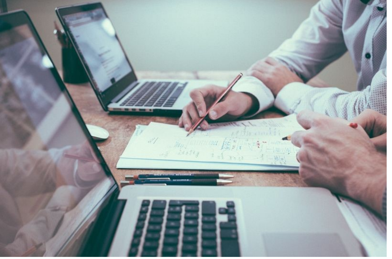
Hızlı Klavye Kursu Merkez Binamızda Açıldı.