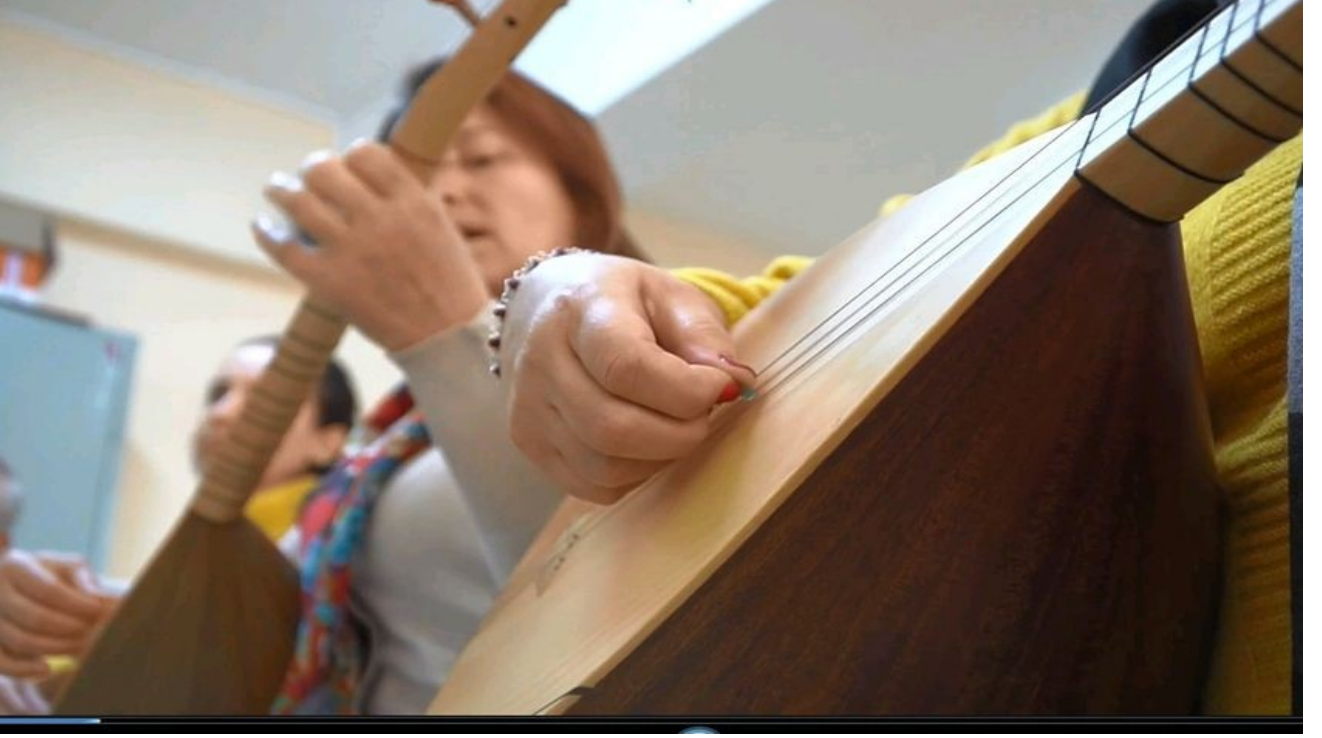
Bağlama Kursu Merkez Binamızda Açıldı.