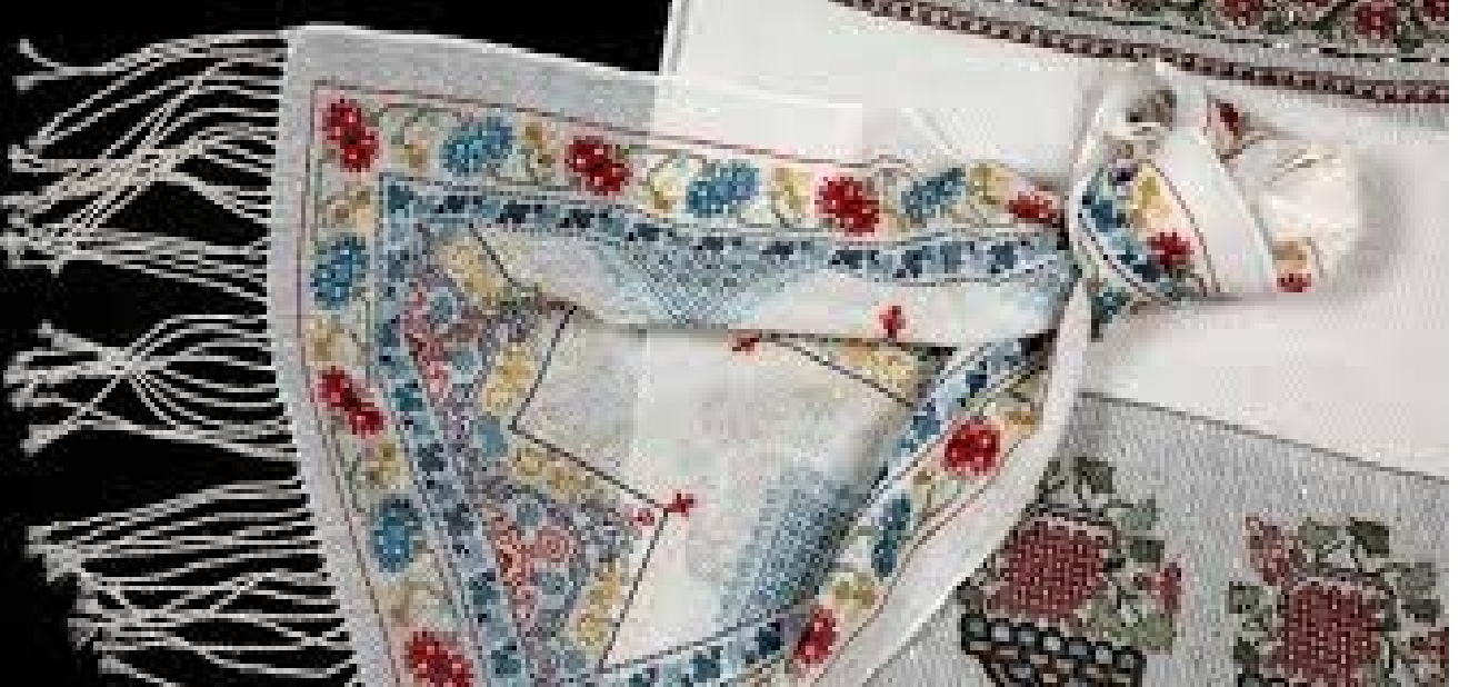
Tuzla Belediyesi/Yaşlılar Merkezi'nde Elde Hesap İşi Kursu Açıldı.