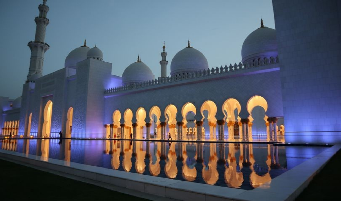
Peyami Safa İlkokulu'nda Kuran-ı Kerim Kursu Açıldı.