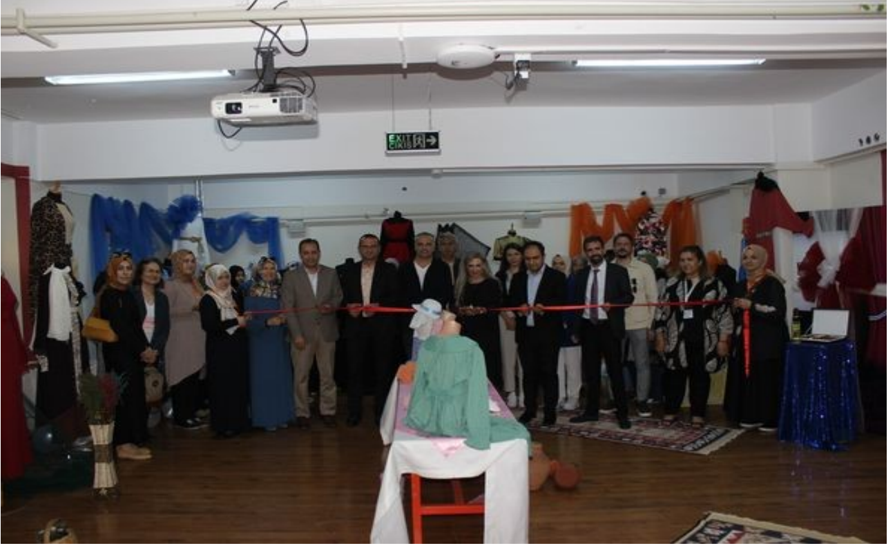
Gazi Mustafa Paşa Ortaokulu Giyim Sergimiz Protokol ve Misafirlerimizin Katılımıyla Açıldı.