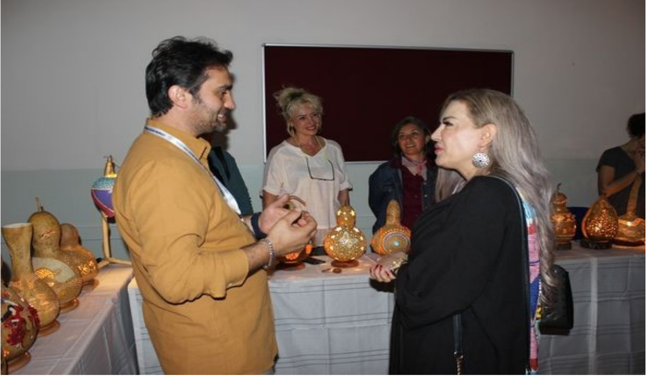
Yunus Emre Anadolu İmam Hatip Lisesi'nde Su Kabađı İřlemeciliđi Sergisi Ađıldı.18 Mayıs 15:30