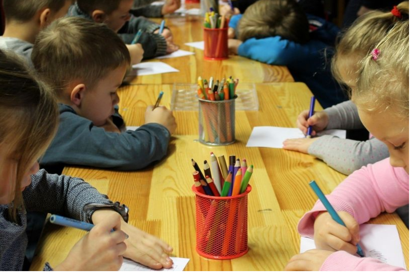
Çocuklarda Uyum Problemleri Kursu Merkez Binamızda Açılmıştır