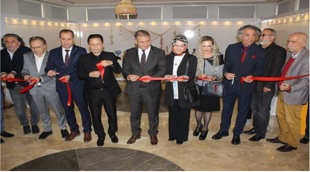
Su Kabađı İşlemeciliđi Sergimiz İlçe Protokolünün Katılımıyla Tuzla Belediyesi Rumeli Kùltür Merkezi'nde Açıldı