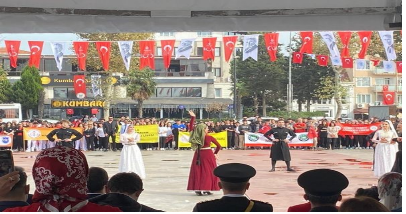
Tuzla Sahil Tören Alanında düzenlenen Bayram Kutlama programına katıldık. Cumhuriyetimizin 100.Yılı Kutlu Olsun.