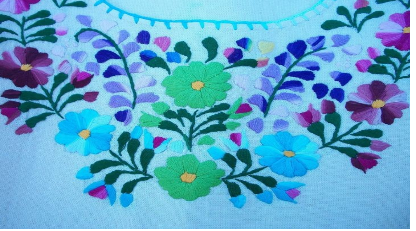
Basit Nakış İğne Teknikleri Kursu Merkez Binamızda Açılmıştır