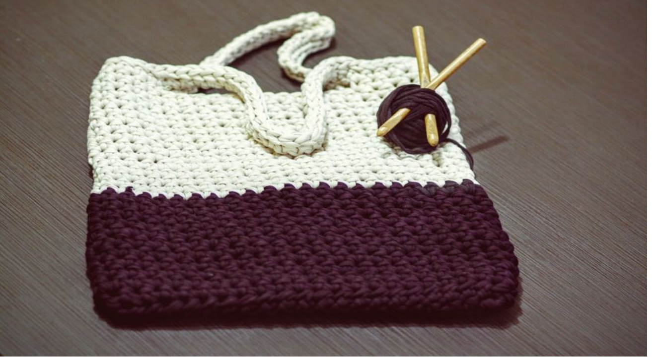
Tuzla Halk Eđitimi Merkezinde ŐİŐ VE TIĐ ŐRÜCÜLÜĐÜ Kursu Açılıyor