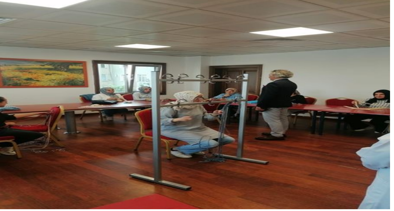
Tuzla Belediyesi Orhanlı AÇEM Kurslarımızı Ziyaret Ettik.