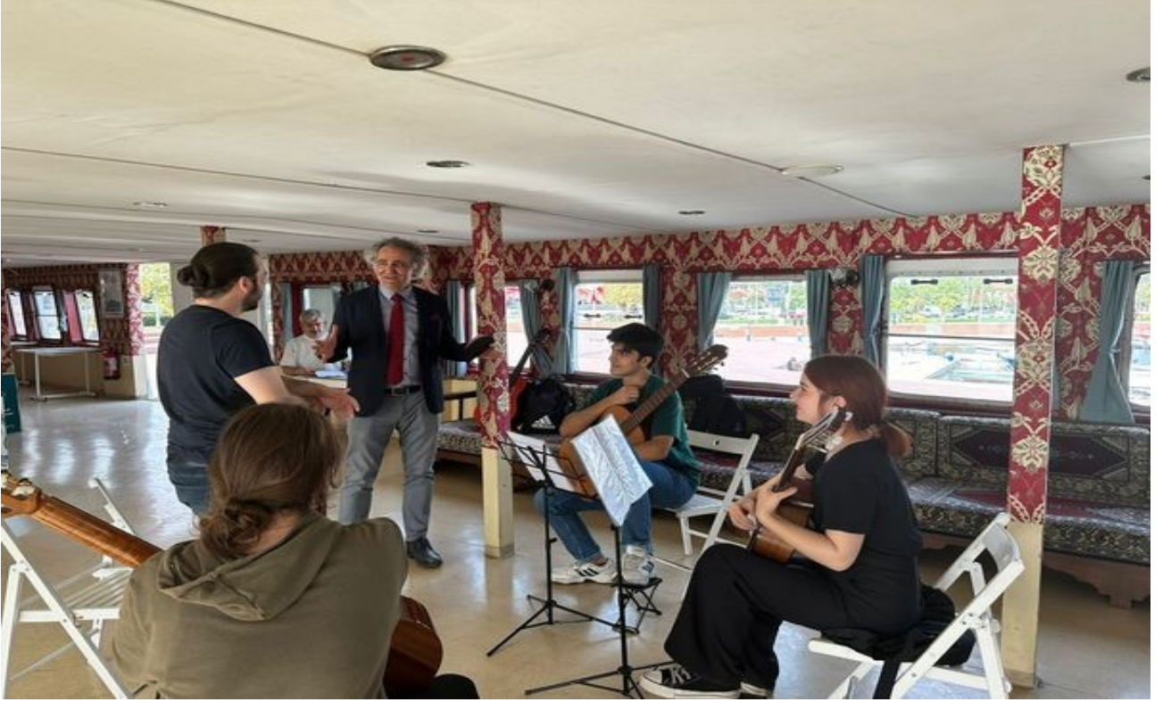
Tuzla Belediyesi Mehmet Akif Ersoy Gemisi Kurslarımızı Ziyaret Ettik