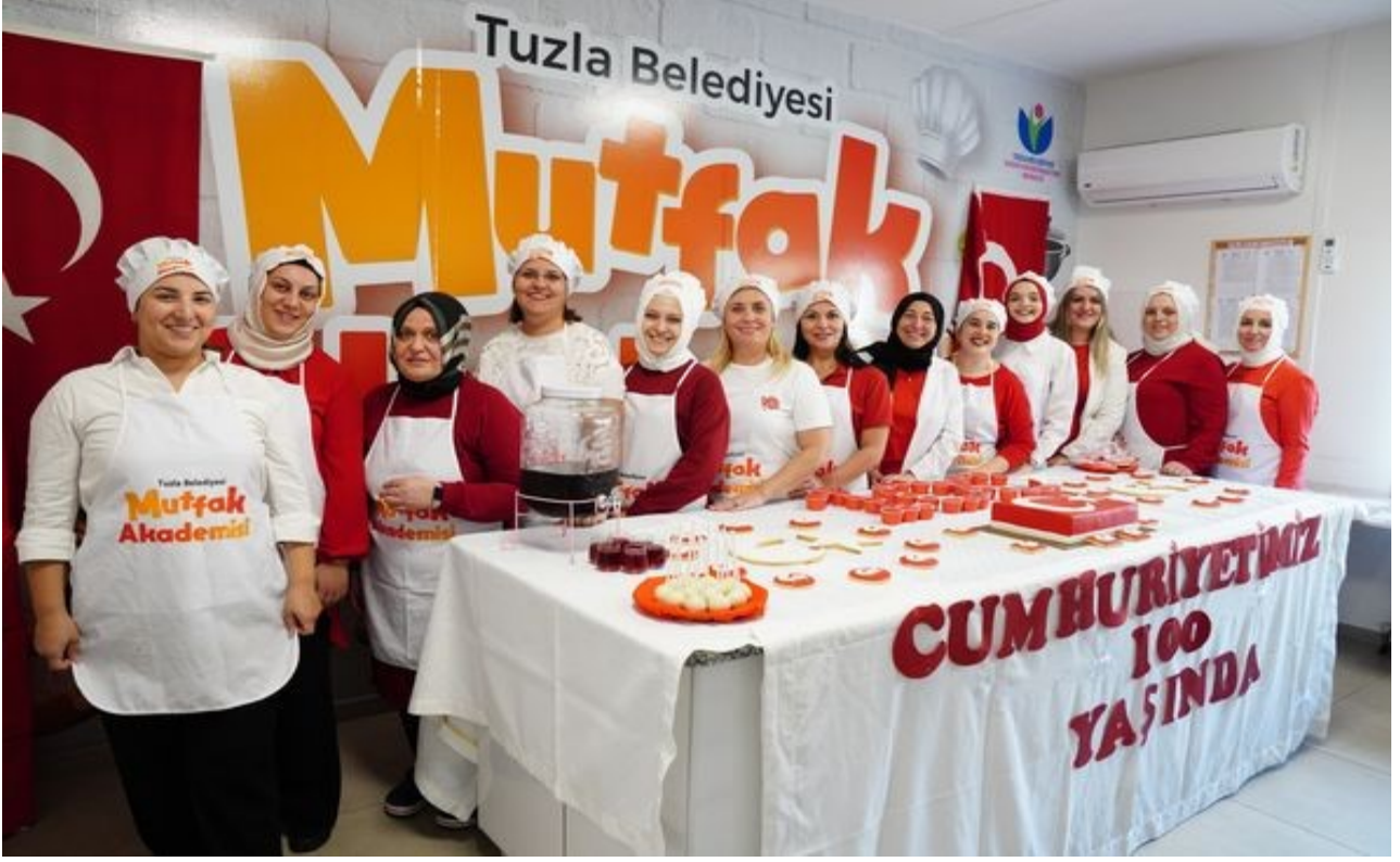
Tuzla Belediyesi AÇEM Pastacılık Kursumuzun Cumhuriyetimizin 100.Yılı Hazırladığı Çalışmalar