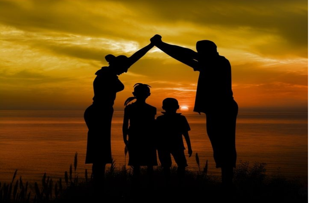
Tuzla Halk Eđitimi Merkezinde OKUL ÖNCESİ ÇOCUK GELİŐİMİ ve EĐİTİMİ KURSU Açılıyor