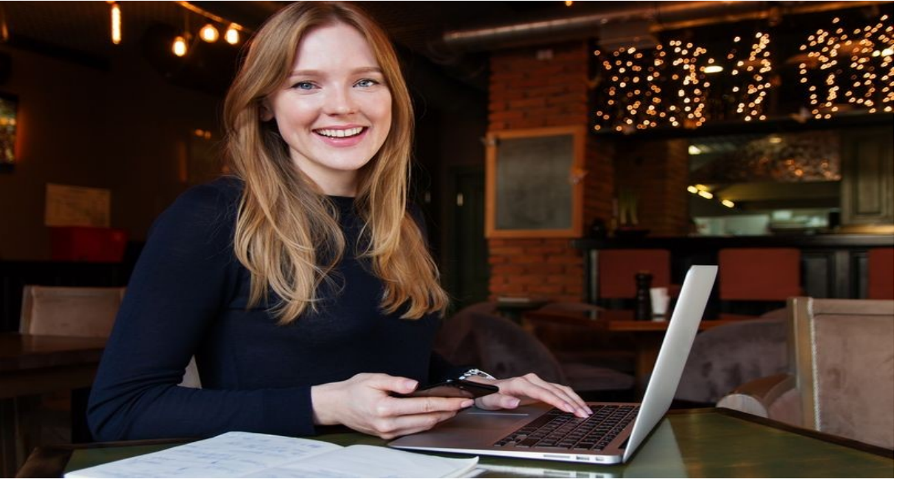
Bilgisayar İşletmenliği (Operatörlüğü) Kursu Merkez Binamızda Açılmıştır.