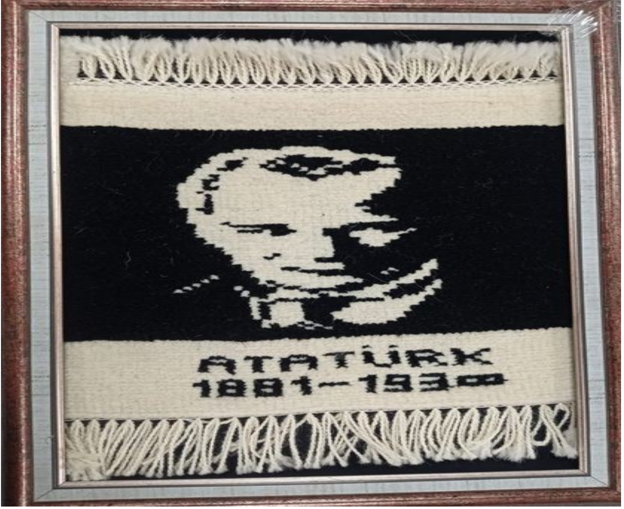
Tuzla Belediyesi Gönülleri Halı Kilim Dokuma Öğretmenimiz Hüsniye AYDIN ve Kursiyerlerinin Cumhuriyetimizin 100.Yılı Hazırladıkları Çalışmalar