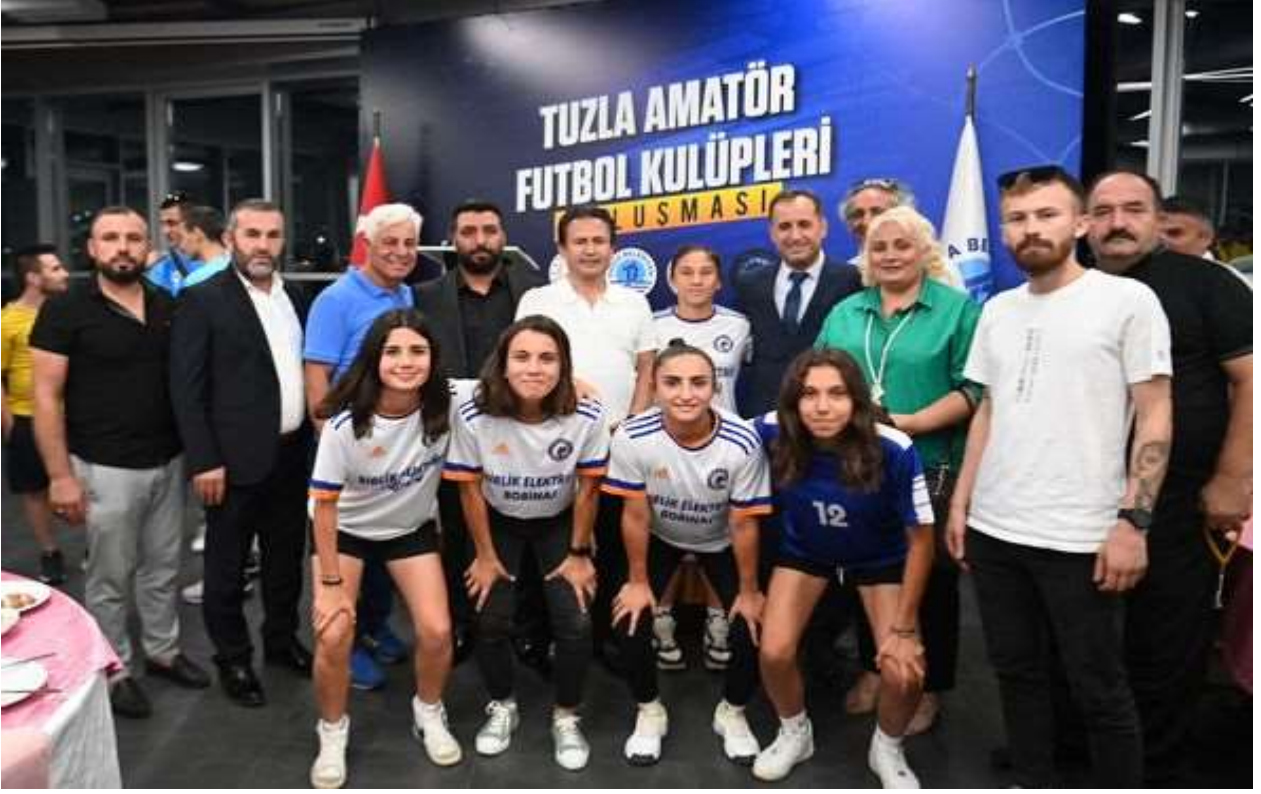
Tuzla Amatör Futbol Kulüpleri Toplantısına Katıldık