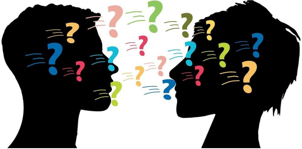
Diksiyon ve İletişim Kursu Merkez Binamızda Açılmıştır.