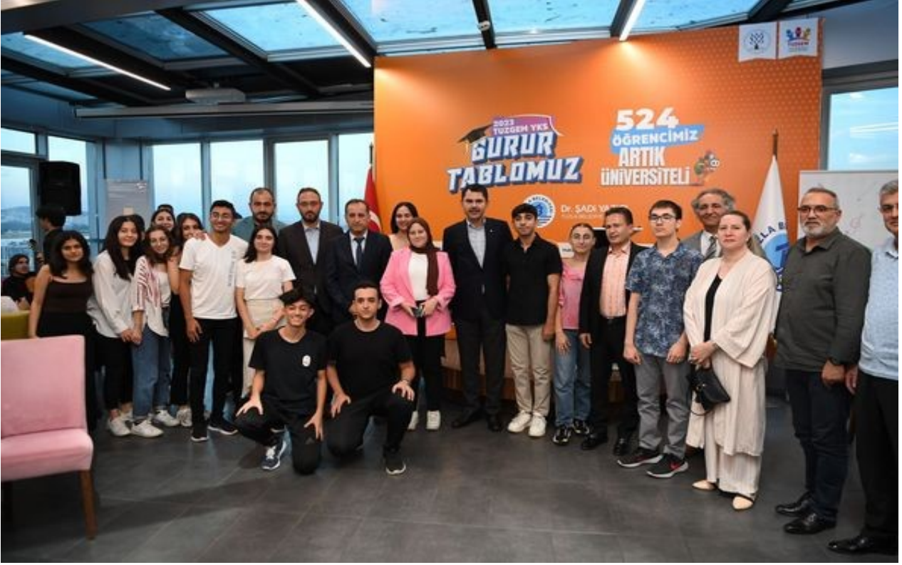
Tuzla Belediyesi ile İşbirliğinde Açılan Destekleme ve Yetiştirme Kurslarımızdaki Üniversiteyi Kazanan Öğrencilerle Buluştuk